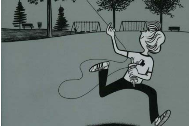
Image tirée de la couverture de Paul au parc.